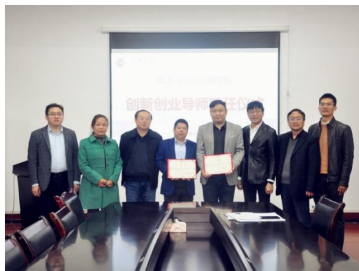
学院领导颁发聘书