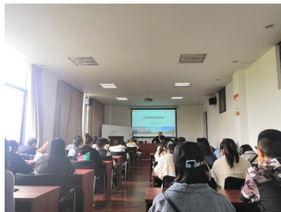
11月7日，学院举行校友讲座