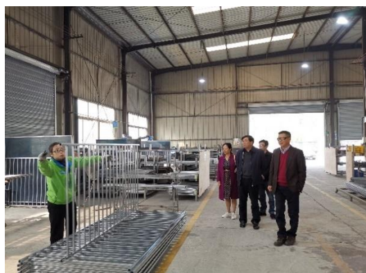
走访参观四川金城栅栏工程有限公司