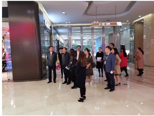
走访参观合信置业集团有限公司