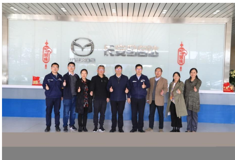
长安马自达公司合影

感激之情，表示下一步将会在与母校已有的合作基础上，在产教融合等方面探讨新的合作途径。