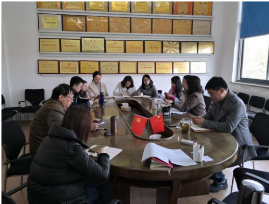
11月6日，学院召开校庆工作推进会