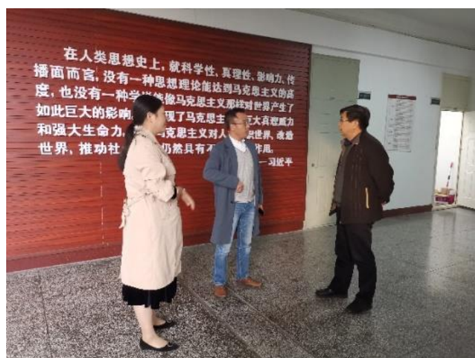
走访马克思主义学院