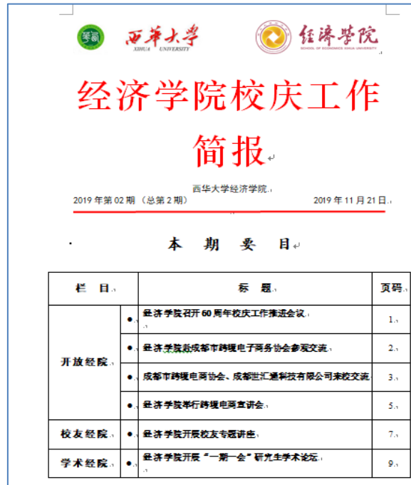
学院校庆工作简报

经济学院高度重视 60 周年校庆工作，精心制作并推出《经济学院校庆工作简报》，积极开展学院校庆系列相关活动。