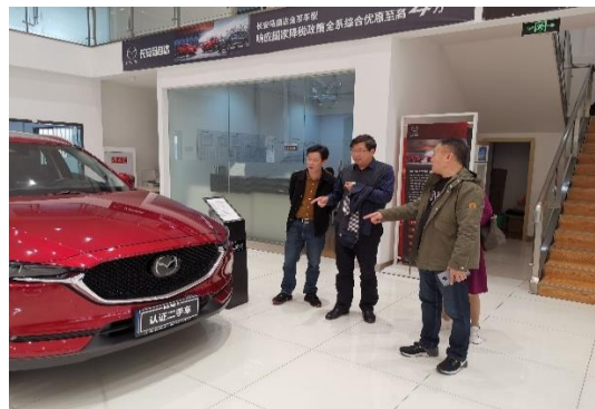
走访参观成都西星汽车投资有限公司