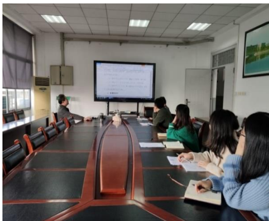
11月6日，学院召开校庆工作推进会