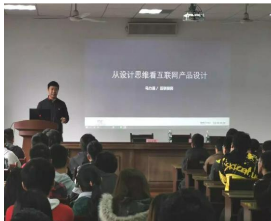
11月8日，学院举行校友讲座